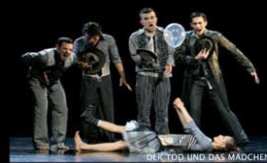
DER TOD UND DAS MÄDCHEN