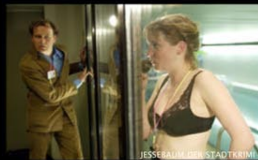
JESSEBAUM DER STADTKRIM