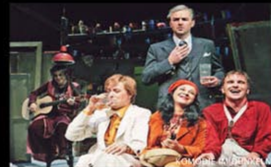
KOMÖDIE 41 DENKEN