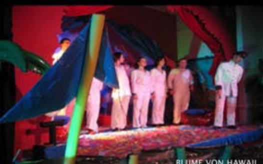
BLUME VON HAWAII